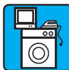
DÉCHETS ÉQUIPEMENT ÉLECTRIQUES ET ÉLECTRONIQUES