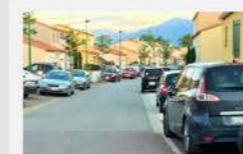
Rue du Vermentino