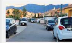
Allée des Malvoisies