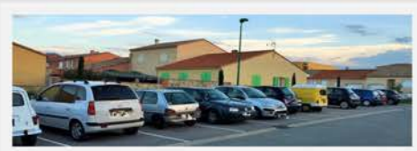
Rue des Macabeus

La période de travaux débutera aux alentours du 25 Juin pour une livraison progressive de 1 à 3 mois.