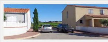
Rue des Macabeus - Voie sans issue

Nettoyage du ravin du « Lotissement Les Vignes »