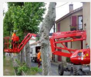
Elagage des platanes Av. de la Mairie