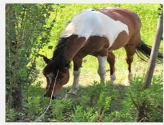
Chevaux en pâturage

Comment parvenir à maintenir un village florissant, sans être gagné par la végétation particulièrement envahissante, conséquence d'un printemps extrêmement pluvieux. Pour cela différents moyens mis en œuvre par la Municipalité