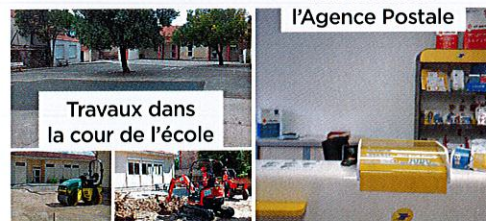
Réfection de l'Agence Postale