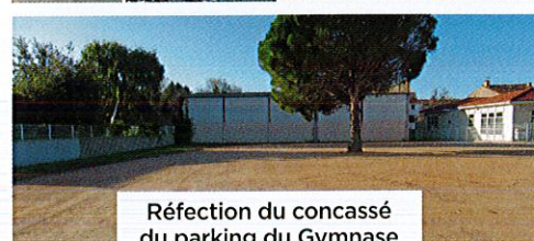
Réfection du concessé du parking du Gymnase