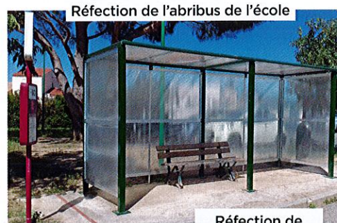
Réfection de l'abribus de l'école

Des travaux importants sont à venir et ont été prévus au budget 2020. L'insonorisation de la cantine, la rénovation de l'espace d'accueil de la Mairie, la pose d'une alarme attentat à l'école, la réfection du sol souple du city-stade sont des chantiers qui seront menés cette année.