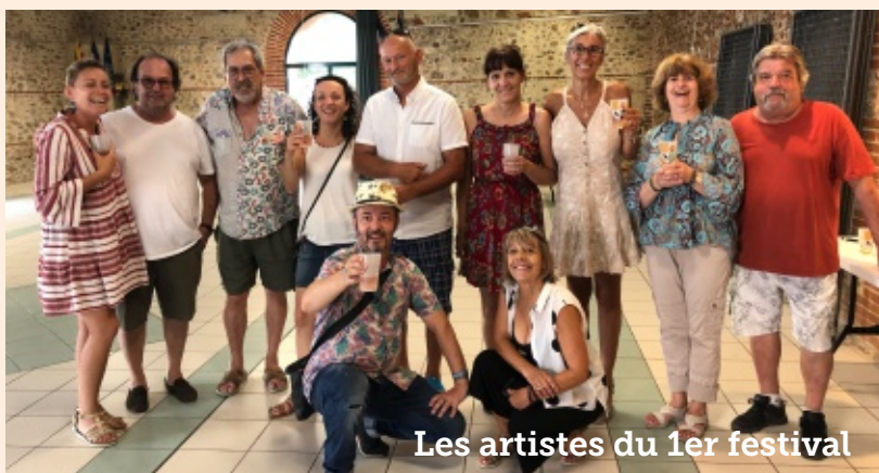
Les artistes du 1er festival

Ce premier festival a permis à tous les passionnés de peinture, praticiens ou simples admirateurs, de pouvoir se rencontrer et échanger. Admirer un tableau, ce n'est pas seulement ressentir des émotions, mais c'est aussi pouvoir les partager avec d'autres. L'art a aussi cette fonction sociale que ces 2 jours de festival auront permis de faire vivre.